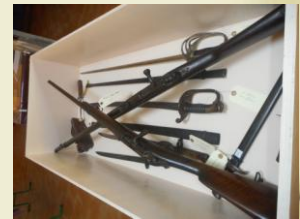
Trésors de nos greniers