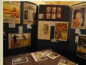
Exposition des affiches et photos