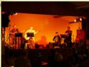
Caf conc du Centenaire