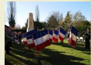
Portes-drapeaux au monument