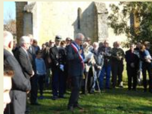
Inauguration du nouvel emplacement